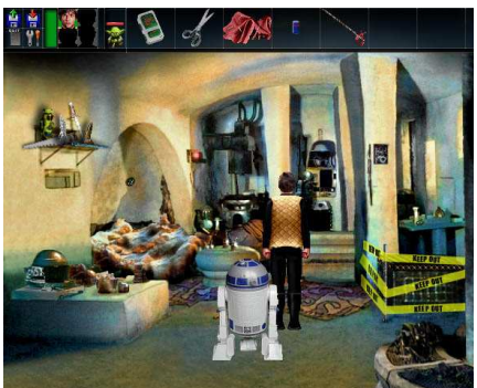
Screenshots de la démo technique proposé par Death Star Games

face semble très fonctionnelle et assez innovante. A propos de l'interface les développeurs annoncent : L'interface utilisateur des OE est née après des heures passées à analyser la GUI des 10-15 dernières années, du glorieux système SCUMM aux interfaces modernes des " Chevaliers de Baphomet " / " Syberia ", en passant par " The Dig " et " Beneath a Steel Sky ". Après de nombreuses discussions, à propos des avantages et désavantages de chacune, et des centaines de lignes de code nous sommes fiers de notre interface, présentant un curseur intelligent, des interactions non bloquantes, souris et raccourci clavier... Concernant la perspective d'un pack de voix, les développeurs annoncent qu'ils ne considèrent pas la possibilité d'en produire un à présent, mais qu'il préfère se concentrer sur le jeu principal sans voix.