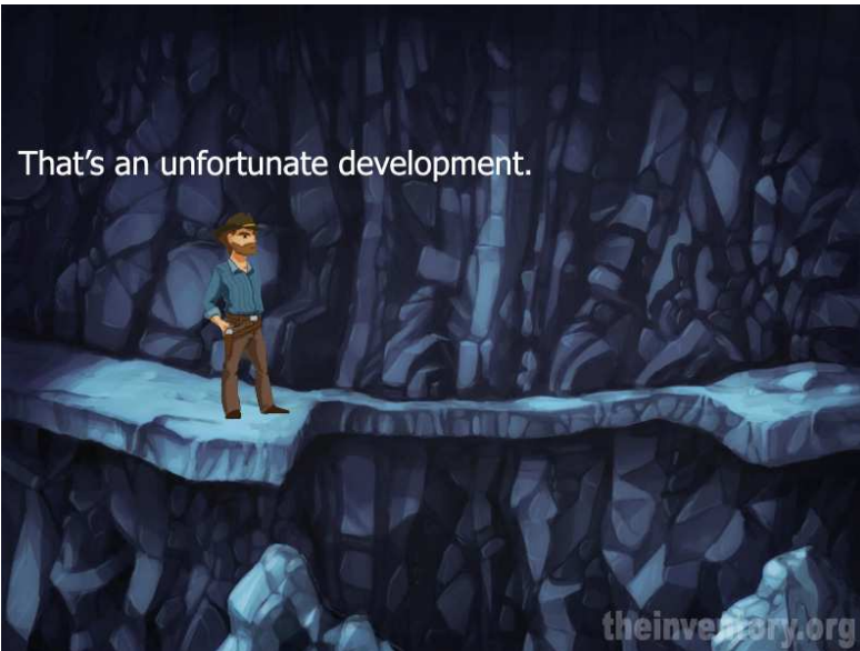
Jake devra surmonter les obstacles en utilisant son intelligence