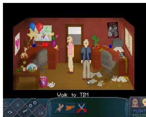
Tiffany et Timothy dans leur bureau

Développeur: Epileptic Fish Perspective: 3ème personne Interface: Point and click Site: davelgil.com Difficulté: Facile