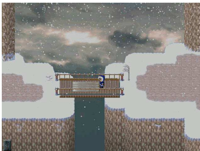
Les Aventures de bureau d'Howard?