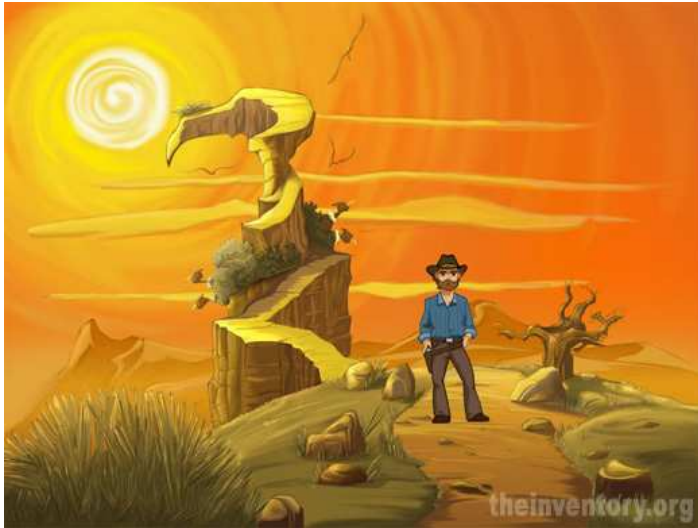
A gauche: Rattlesnake Jake Dawson, le héros principal de Rise of the Hidden Sun A droite: Une affiche pour le jeu