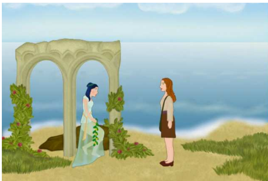
Cette fée déprimée a besoin de l'aide de Linda, sinon elle mourra.

“Five magical amulets un très bon jeu d'aventure fantasy et certainement l'un des 1ers compétiteurs pour notre "award" du Meilleur Jeu d'aventure Indépendant 2005.”