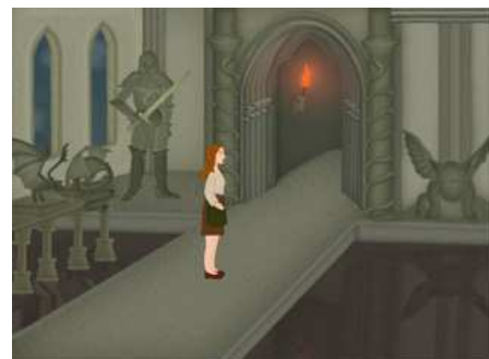
En dessous: Dans le château de Zarkyrán

Développeur: Off Studio Perspective: 3ème personne Interface: Point and click Site: offstudio.fabry.cz Difficulté: Facile