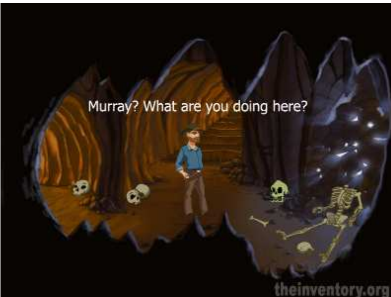
Une guest star qui n'est autre que le grand Murray de Curse of Monkey Island