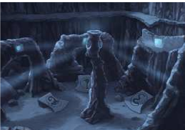
Les décors faits à la main sont époustouffants

de voix, l'équipe n'a pas encore décidé s'ils allaient utiliser des artistes ou non. Écoutons Josh Roberts : "Les meilleurs jeux " classiques " n'ont jamais eu besoin de voix d'acteurs pour bien marcher, mais les joueurs actuels espèrent les découvrir. Probablement ce que nous ferons dans un pack d'expansion une fois le jeu initial sorti. Si des voix sont mises, je les voudrais parfaites. De mauvaises voix sont tout à fait capables de tuer un jeu qui est excellent autrement."