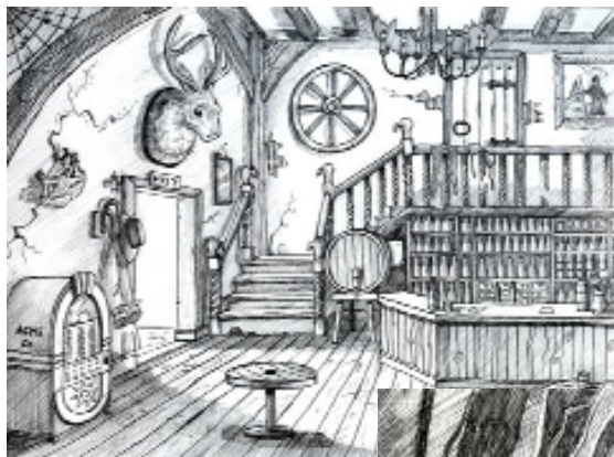
Quelques dessins de haute qualité basés sur le jeu