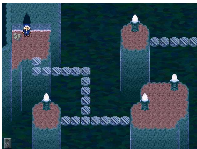
Une des énigmes amusantes de Catacombic