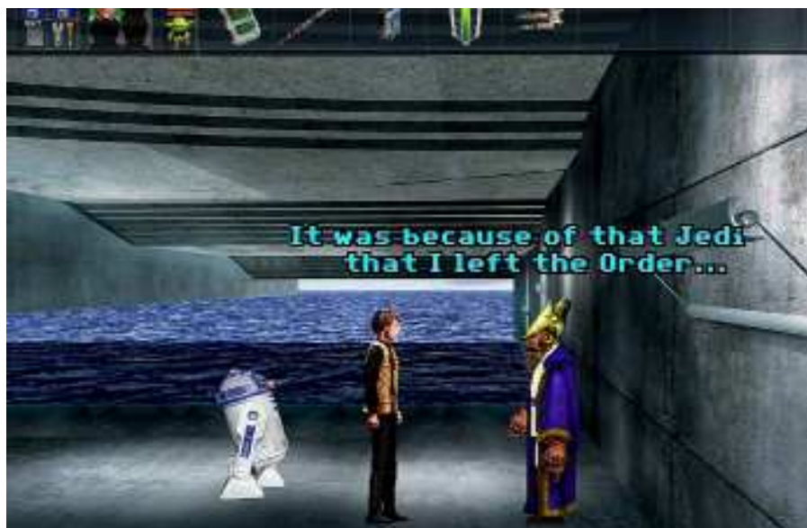
SotE utilise des graphismes photoréalistes

La démo montre beaucoup de potentiel. D'abord les créateurs du jeu ont un bon sens de l'humour. Je me suis surpris à ricaner durant la démo, du début à la fin. Bien sûr, pour comprendre la plupart des blagues, vous devez soit connaître Star Wars, ou avoir joué à des jeux d'aventures Lucasarts (être un membre de la communauté AGS aidera aussi). Si vous ne faites pas partie de l'une de ces trois catégo-