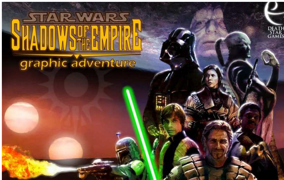
Le poster pour Star Wars: Shadows of the Empire par Death Star Games

Beaucoup d'aventuriers soutiendront que Lucas Arts durant les années 80 et 90 était l'une des compagnies les plus créatives pour embellir notre genre. Qui pourra jamais oublié des grands titres tels que Indiana Jones and the Fate of Atlantis, Loom, Sam et Max et Monkey Island. On doit se demander cependant, pourquoi la compagnie la plus connue pour ses jeux d'aventures et sa licence Star Wars, n'a jamais sorti de jeu d'aventure Star Wars. Maintenant une équipe de développeurs indépendants appelée Death Star Games, travaille sur le jeu d'aventure que nous n'avons jamais eu par Lucas Arts.