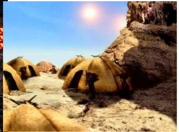
A gauche: Lando, un des personnages jouables Sote. A droite: Des décors du jeu.