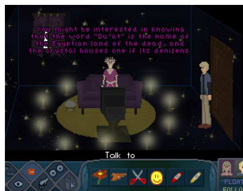
L'histoire explore le paranormal